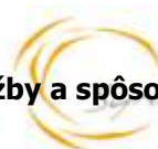
Tabuľka 5 Denná sadzba úhrady za poskytovanie vecných plnení v spoločných priestoroch