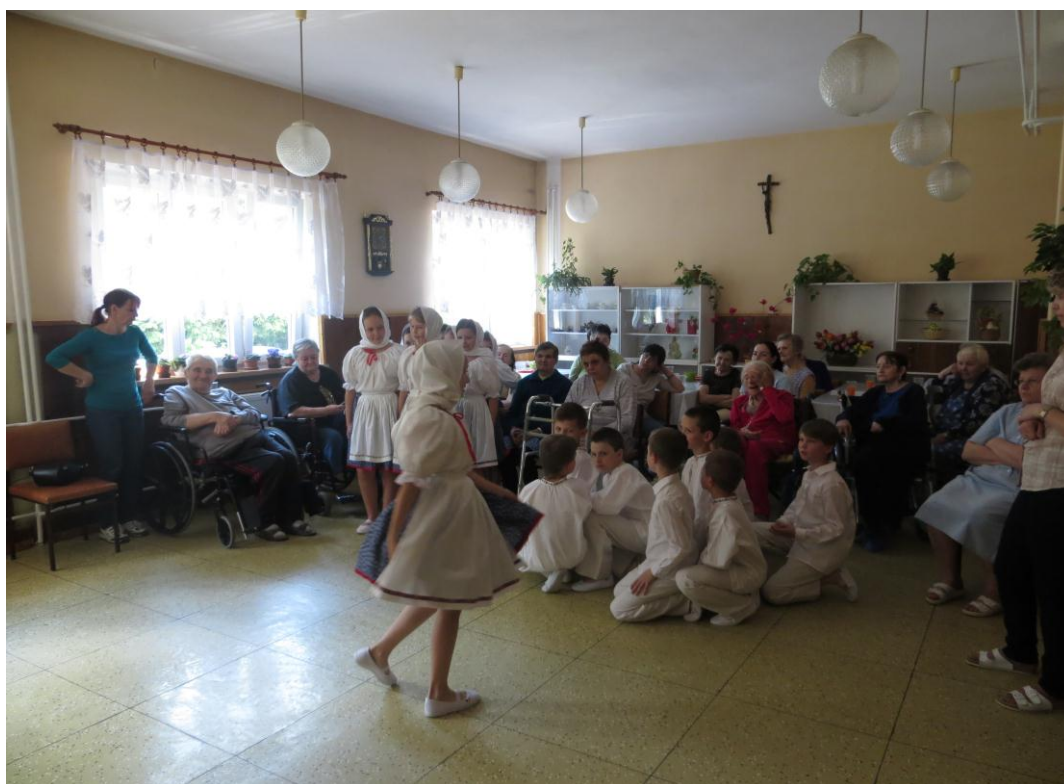
▪ Vystúpenie detí zo Základnej umeleckej školy