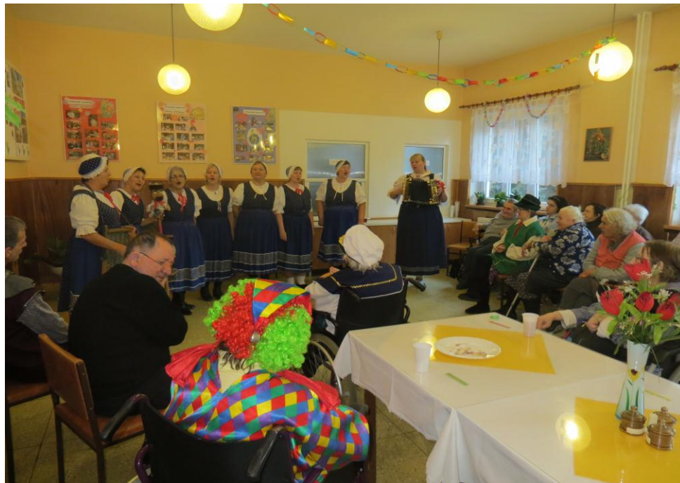
▪ Fašiangová zábava