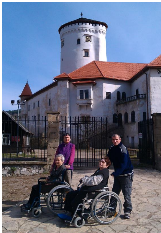
• Prechádzka v Budatínskom parku