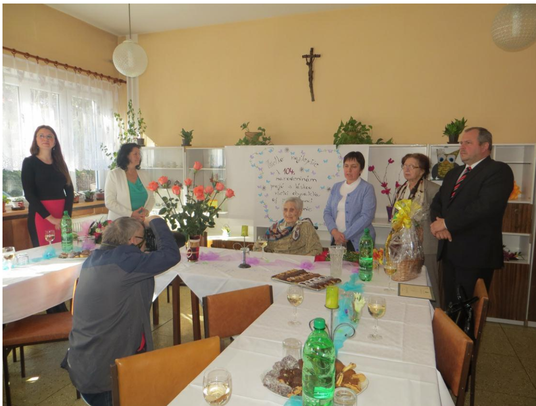
▪ Oslava životného jubilea – 104. narodeniny obyvateľky zariadenia