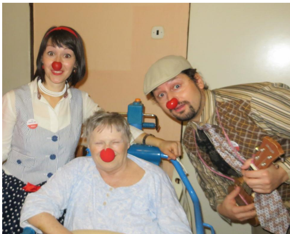
• Zdravotní klauni v HARMÓNII