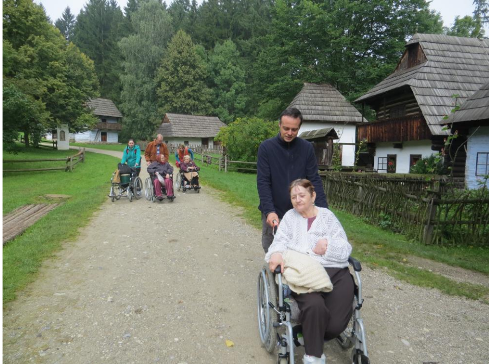
▪ Výlet do Múzea Slovenskej dediny v Martine