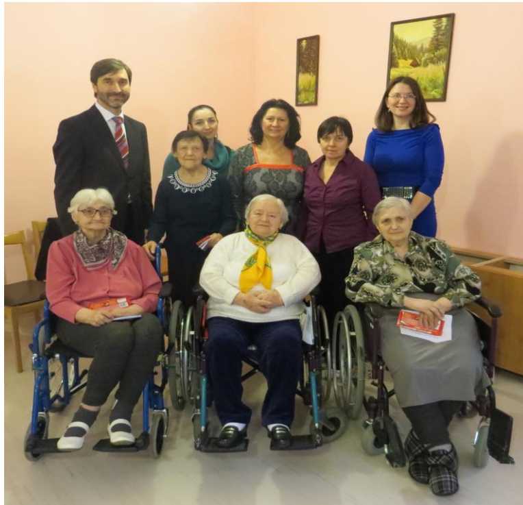
▪ Návšteva predsedu Žilinského samosprávneho kraja