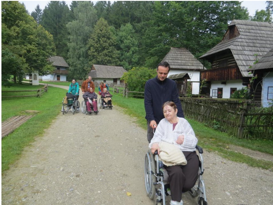
▪ Výlet do Múzea Slovenskej dediny v Martine