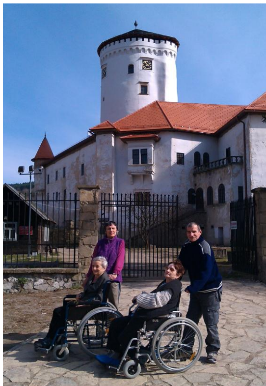
• Prechádzka v Budatínskom parku