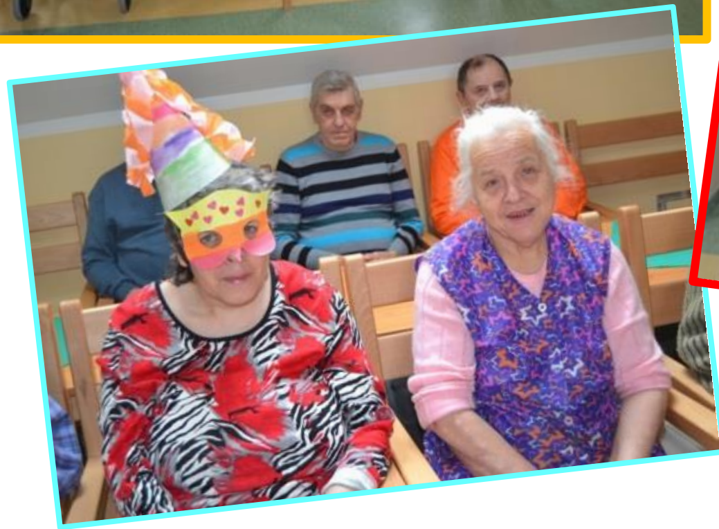
Na fašiangovej zábave nechýbali ani krásne masky, ktoré si klienti vyrobili sami.