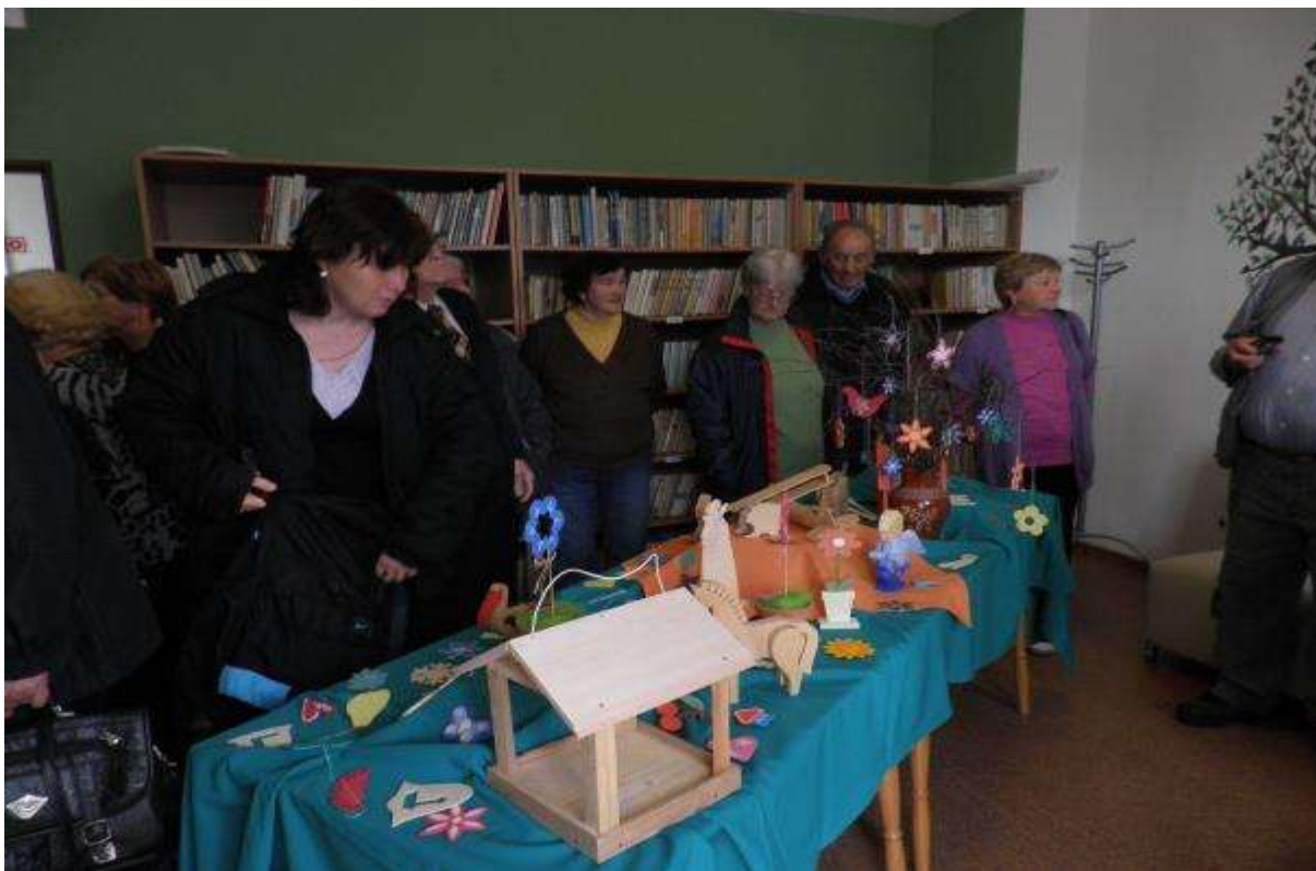
UKONČENIE PROJEKTU „TVORÍME SPOLOČNE“ - VÝSTAVA, 7. október 2013