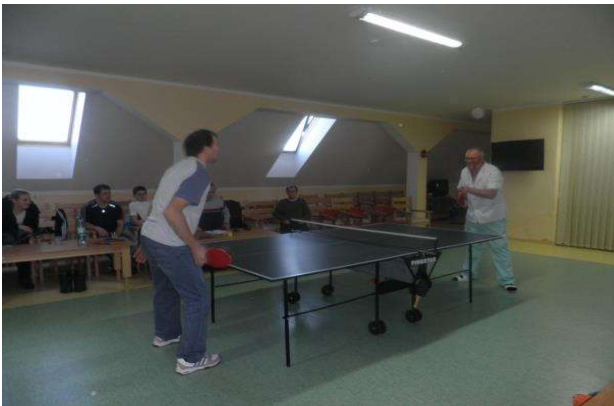
STOLNOTENISOVÝ TURNAJ 2013