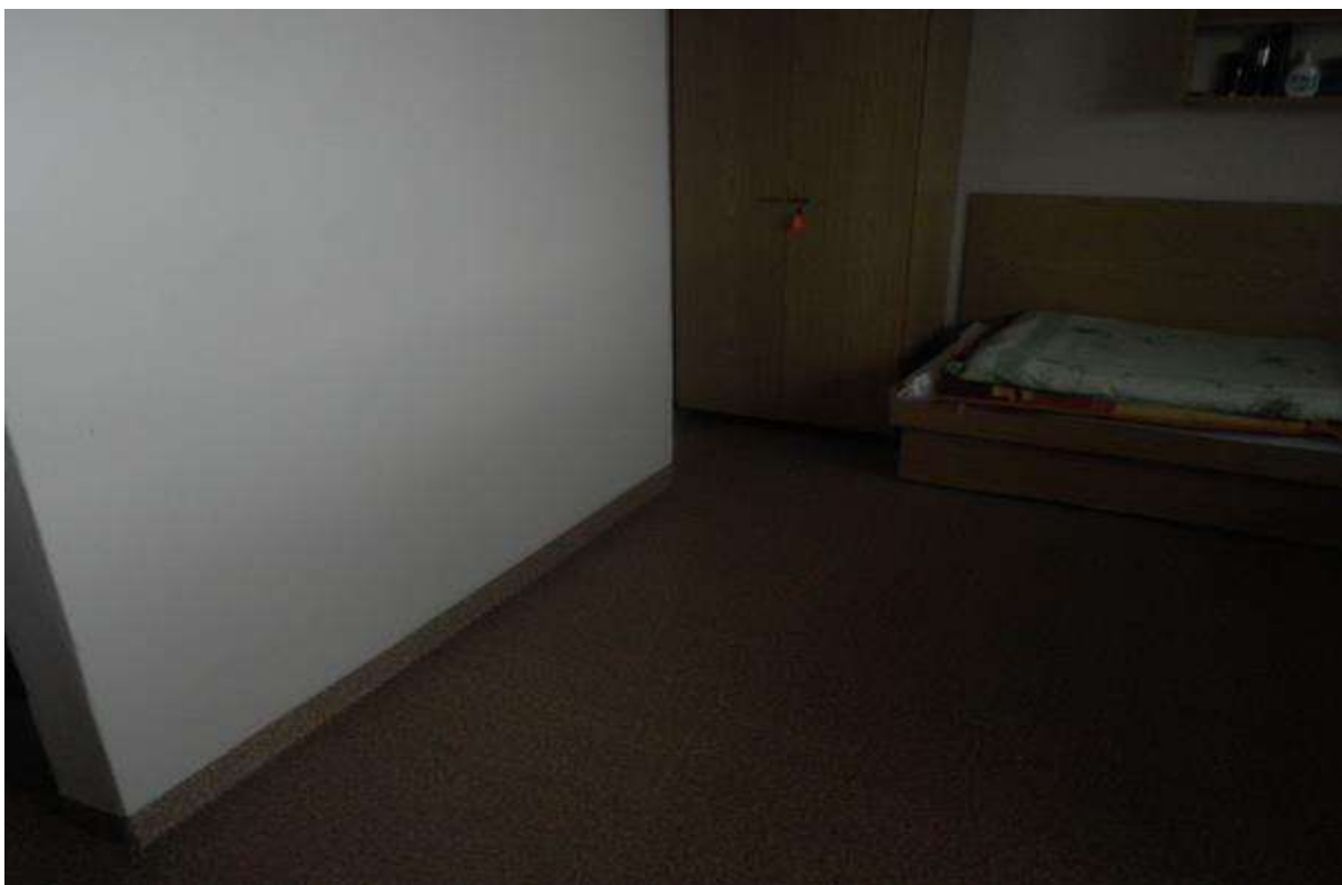
VÝMENA PODLAHOVEJ KRYTINY