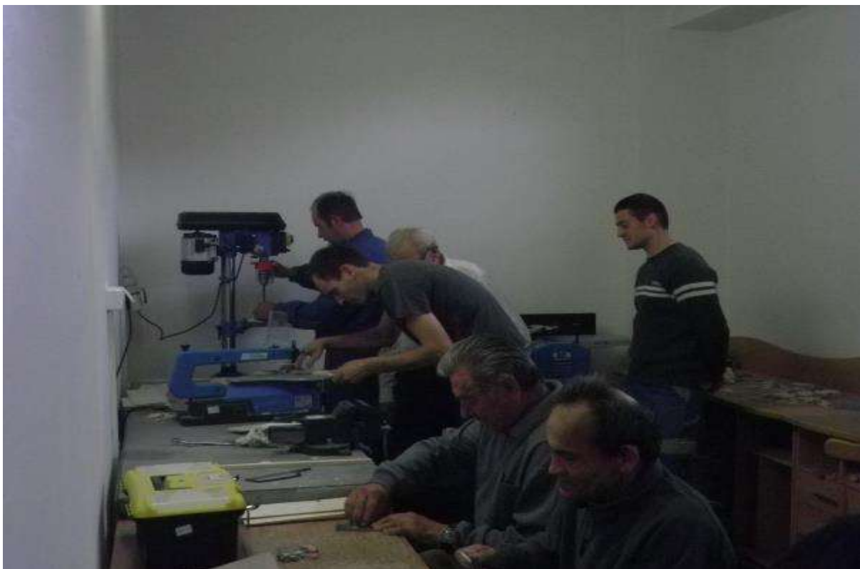
KLIENTI V NOVEJ STOLÁRSKEJ DIELNI, 6. júl 2013