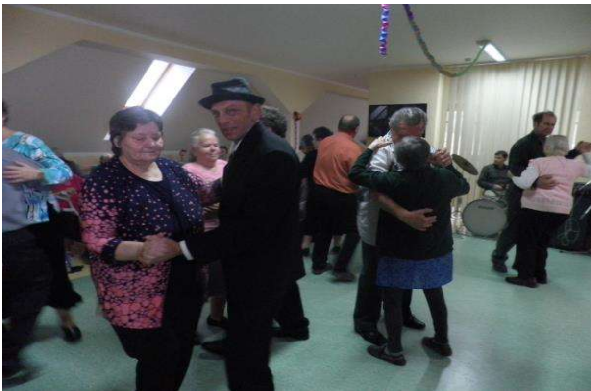
KATARÍNSKA ZÁBAVA, 21. november 2013