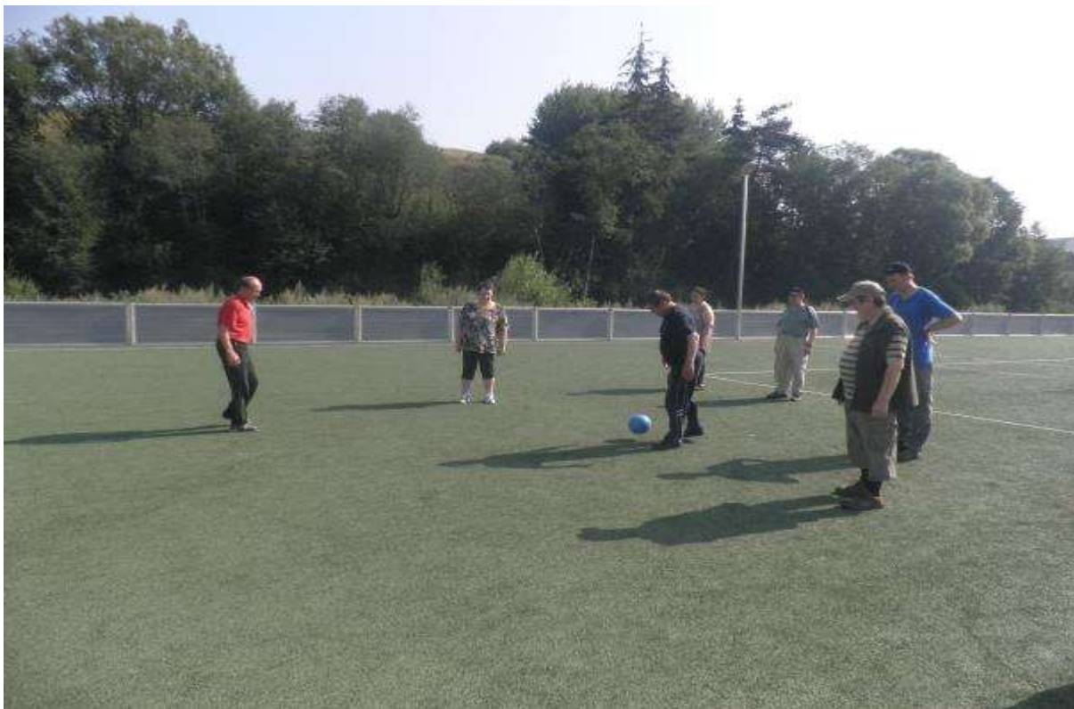
ŠPORTOVÝ DEŇ, 7. august 2013