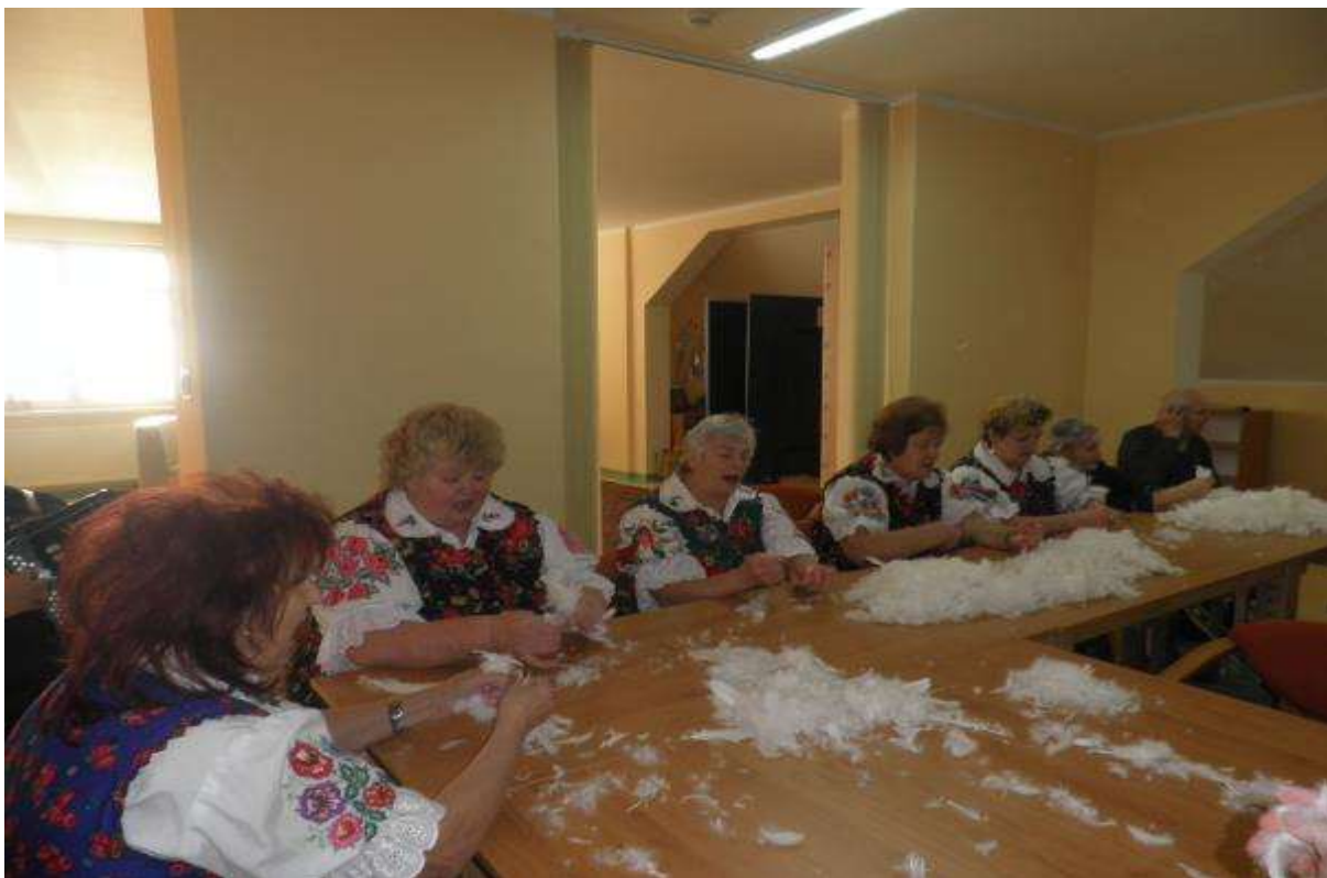
SPOLOČNÉ PÁRANIE PERIA, 11. február 2013