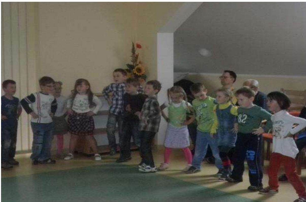
OSLAVA DŇA MATIEK