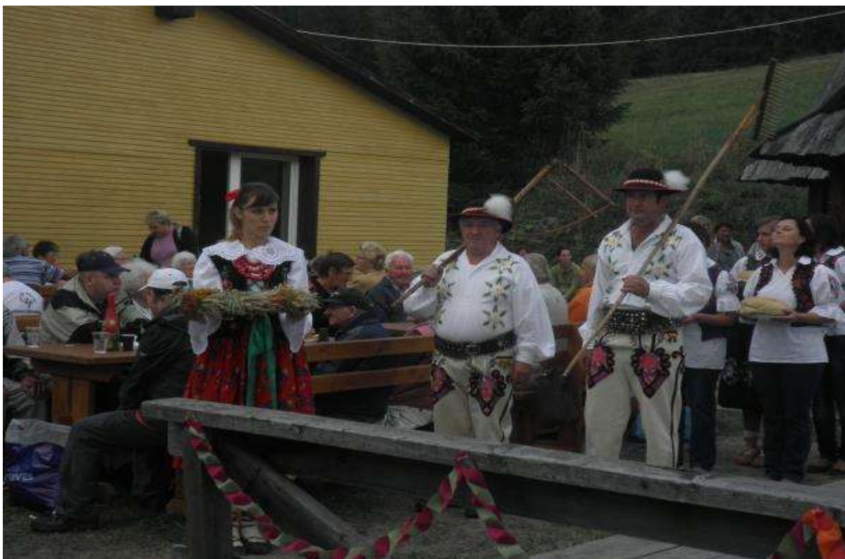
DEŇ SENIOROV NA ORAVSKEJ GAZDOVKE, 5. september 2013