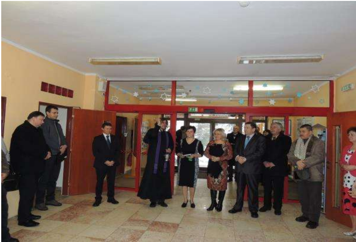
KOLAUDÁCIA, 25. január 2013