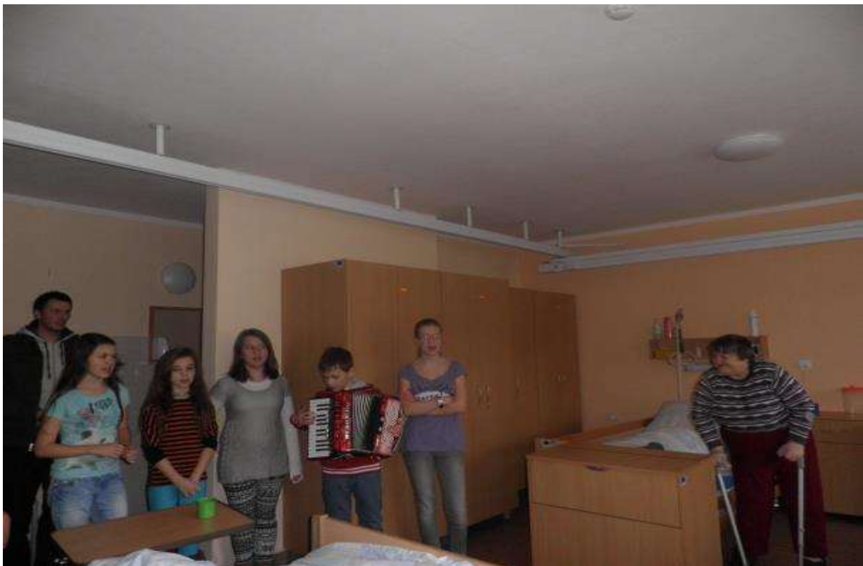
NAVŠTEVA DETI Z FARSKEHO KLUBU LOKCA, 27. december 2013