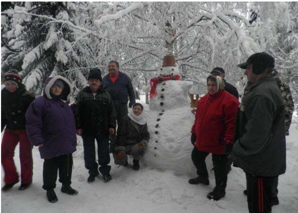
STAVANIE SNEHULIAKA, 7. február 2013