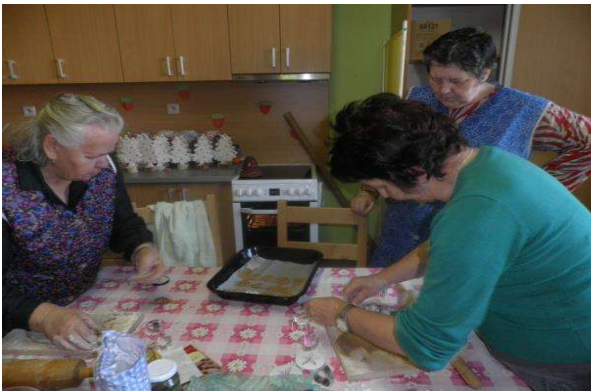
PEČENIE MEDOVNÍKOV, 18. december 2013