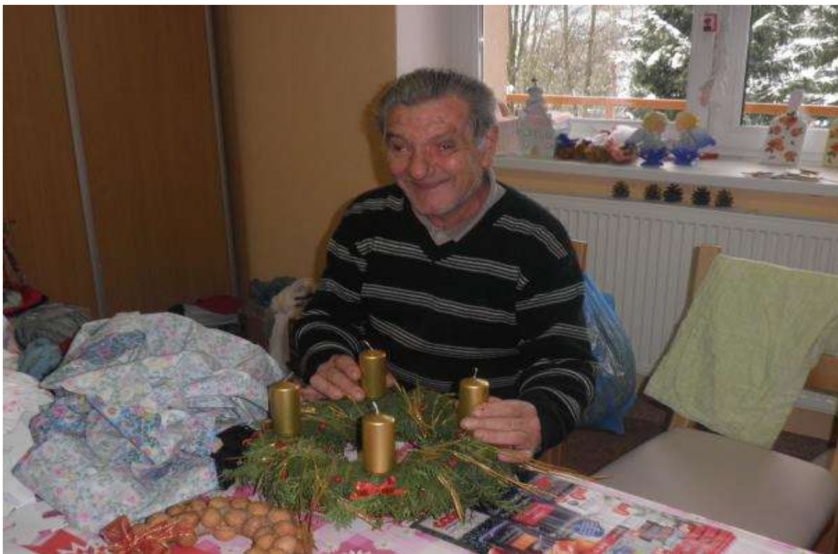
VÝROBA ADVENTNÝCH VENCOV, 29. november 2013