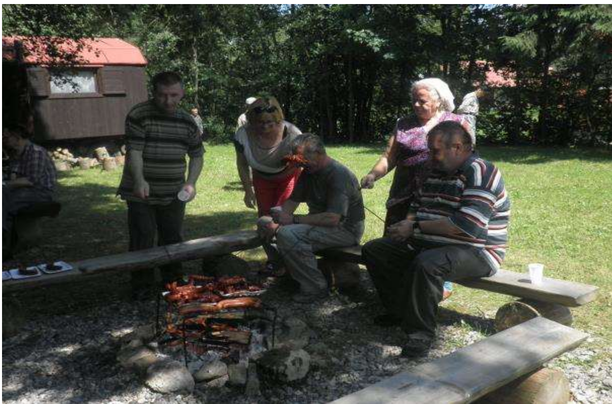
OPEKAČKA V PRÍRODE, 3. júl 2013