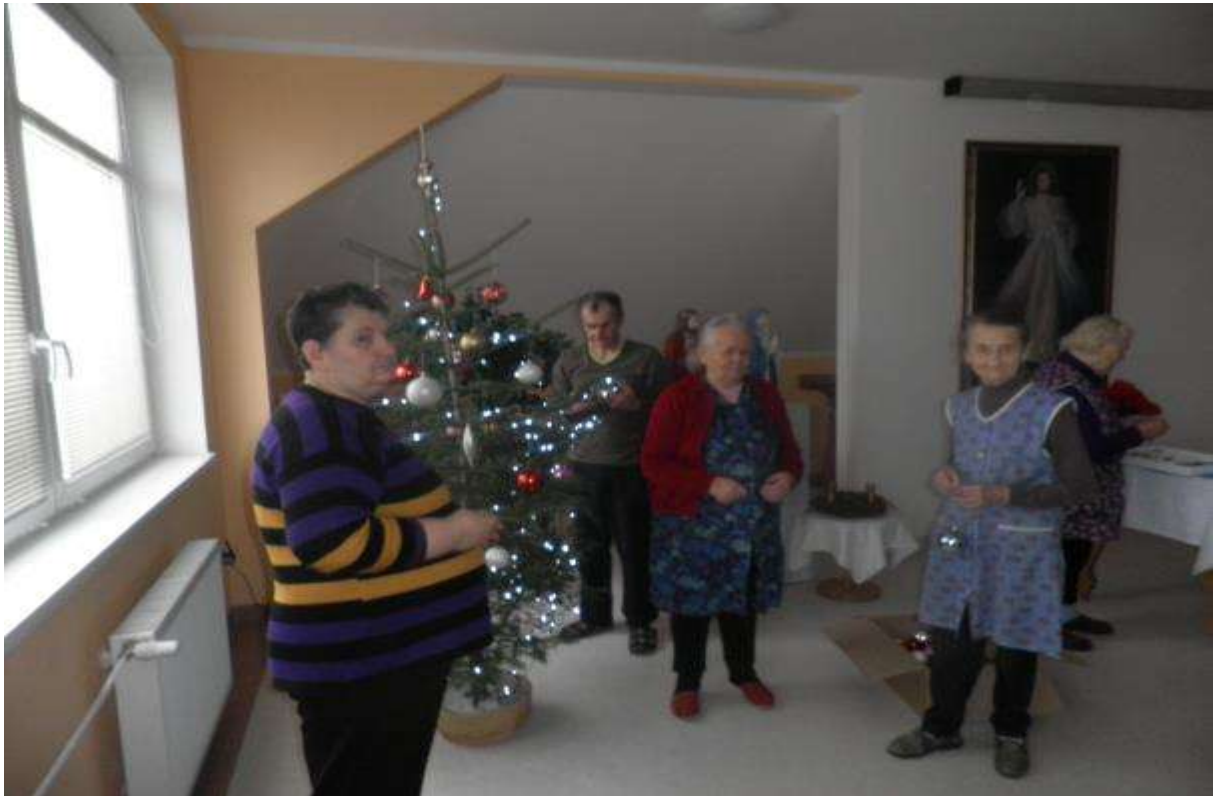
ZDOBENIE VIANOČNÉHO STROMČEKA, 23. december 2013