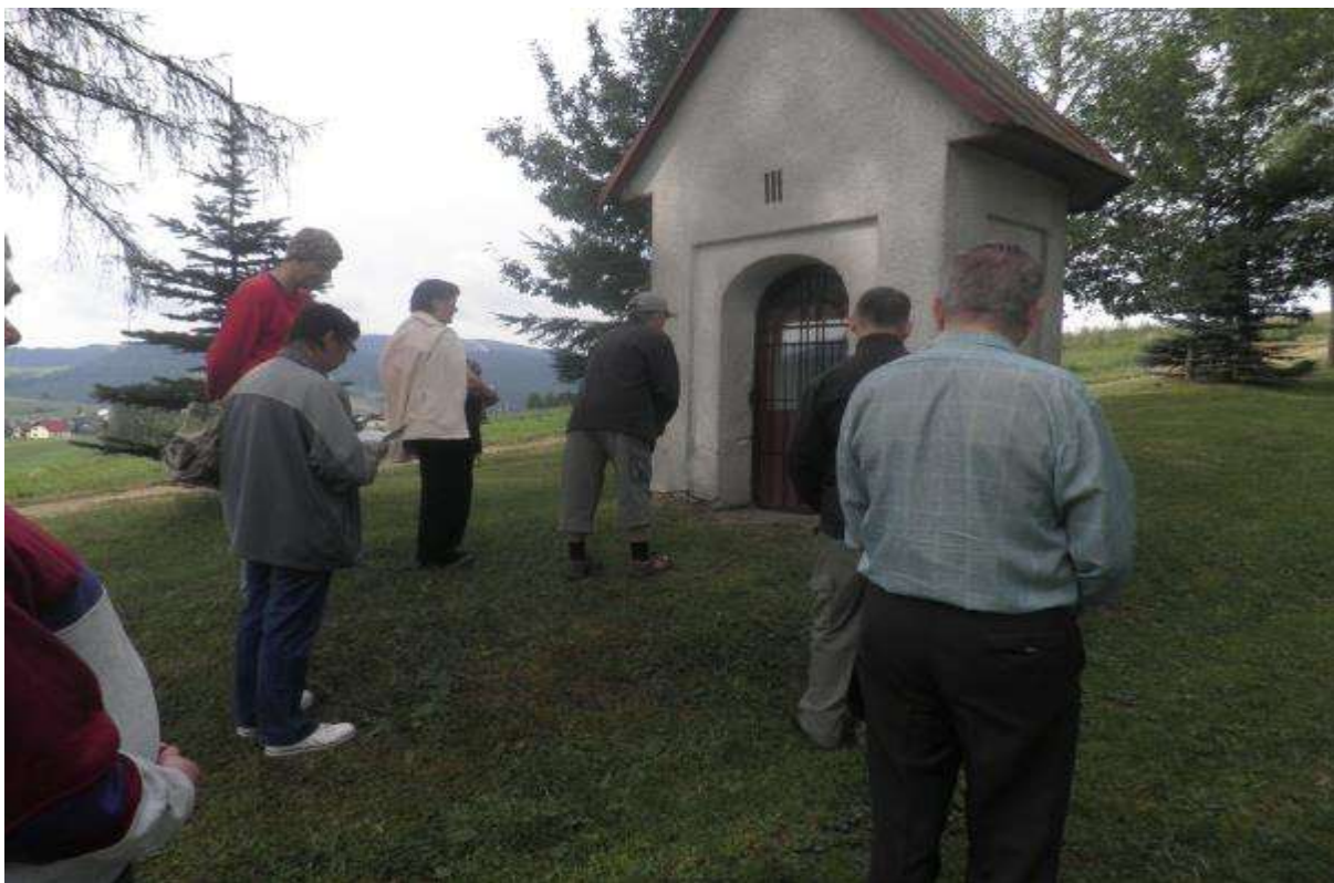
PŮŤ NA KALVÁRIU V ZÁKAMENNOM, 14. august 2013