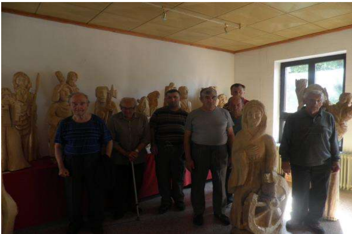
NÁVŠTEVA REZBÁRA V BABÍNE, 29. júl 2013