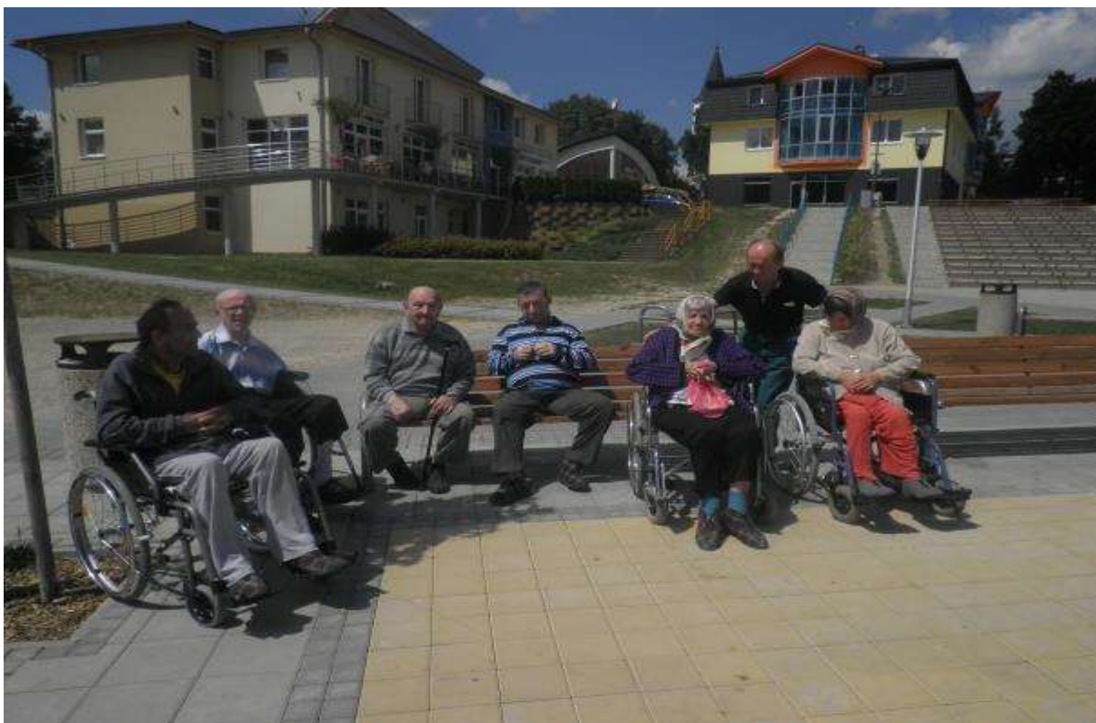
VÝLET ORAVSKÁ PRIEHRADA, 23. júl 2013